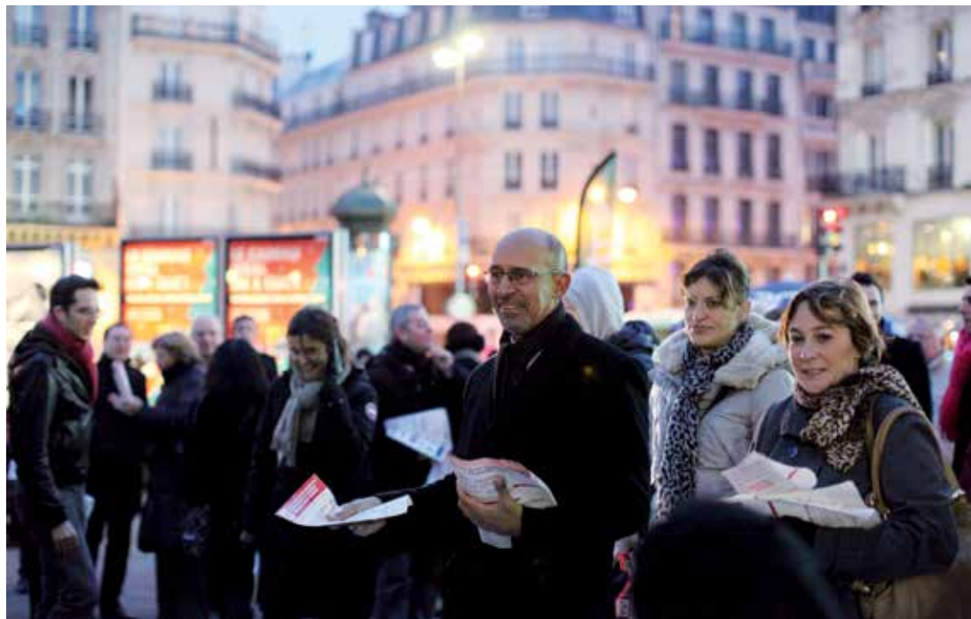
Harlem Désir participait à un tractage devant la gare Saint-Lazare, mercredi 9 janvier 2013